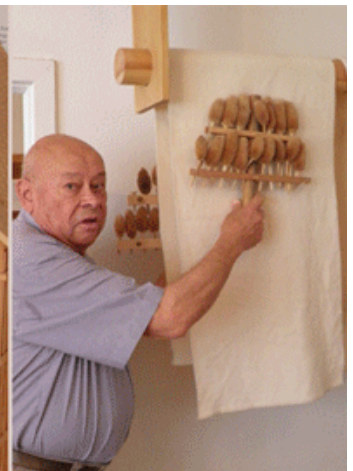
Handhabung der Karde im Mittelalter