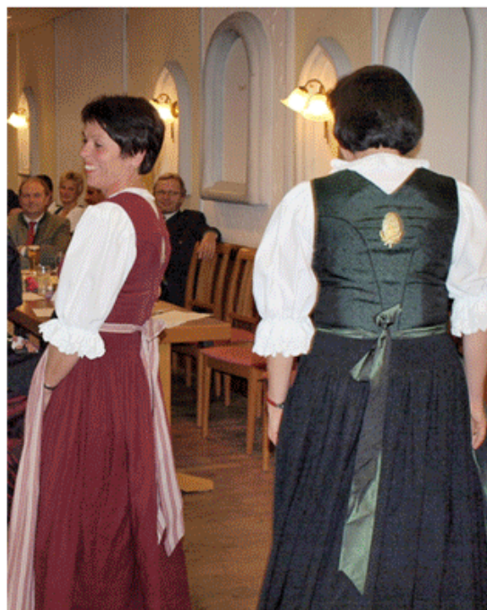
Die Karde aufgestickt auf der Katsdorfer Tracht