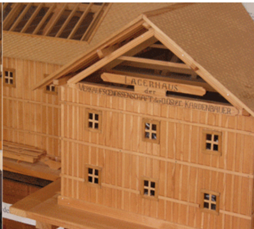
Kardenstadel in Lungitz