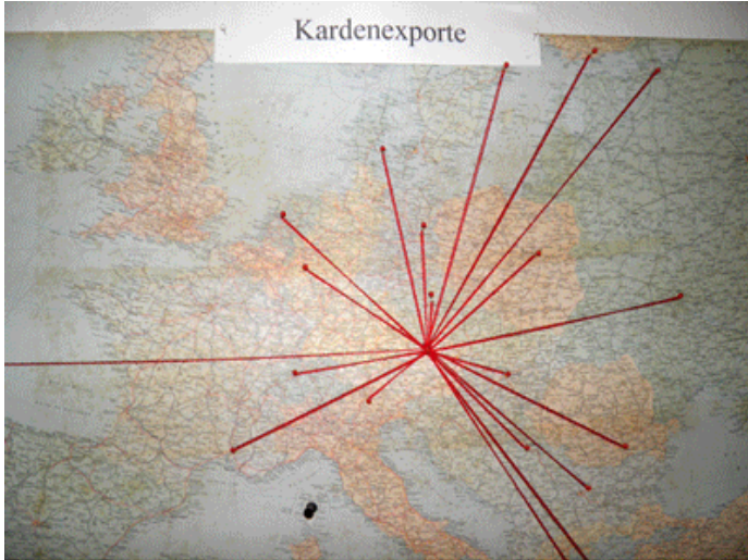
weltweite Auslieferung der Weberkarde

Die Karden wurden in 2 Ausführungen hergestellt: Einerseits mit einem kurzen Stiel für die Verwendung von Handgeräten, andererseits als Rollkarden für den Einsatz bei der maschinellen Bearbeitung der Wollstoffe. Für die Verwaltung wurde 1936 ein eigenes Gebäude errichtet, welches heute noch als Wohnhaus genutzt wird. Der Kardenstadel selbst wurde 1955 durch einen Sturm zerstört und da die Verkaufszahlen aus verschiedenen Gründen stark rückläufig waren, wurde der Stadel nicht wieder aufgebaut und die Genossenschaft aufgelöst. Im Museum sind noch mehrere Aufzeichnungen über An- und Verkauf sowie Bilanzen vorhanden