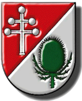
Die Karde im Katsdorfer Gemeindewappen